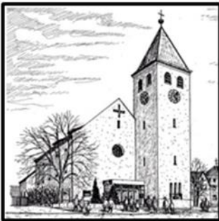
Herz Jesu - Kohlberg