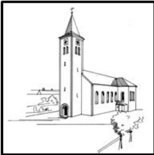
St. Martin – Kaltenbrunn