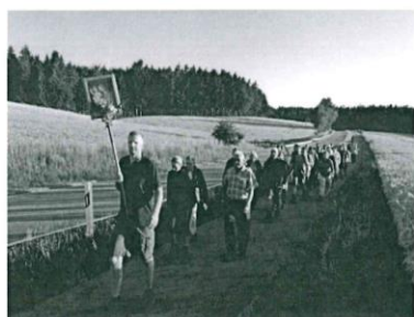
Fußwallfahrt 2019 (Zulauf auf Pursruck)

In Amberg wird um 09:00 Uhr der Pilgergottesdienst für die Fußwallfahrer aus Weierhammer und Kohlberg gefeiert.