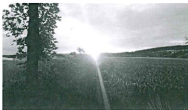
Sonnenaufgang in Krickelhof 2017

Auch in diesem Jahr übernimmt die Freiwillige Feuerwehr Weierhammer wieder den Begleitschutz und die Organisation der Pausen. Dafür gilt ihr schon im Voraus unser aller Dank!